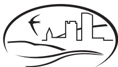
Biologische Station Bonn/Rhein-Erft e.V.

Nach einer Einführung in der Biologischen Station stehen auf 6 Exkursionen à ca. 3 h in Wäldern, Wiesen und Feldern die häufigsten wild wachsenden Arten im Mittelpunkt.